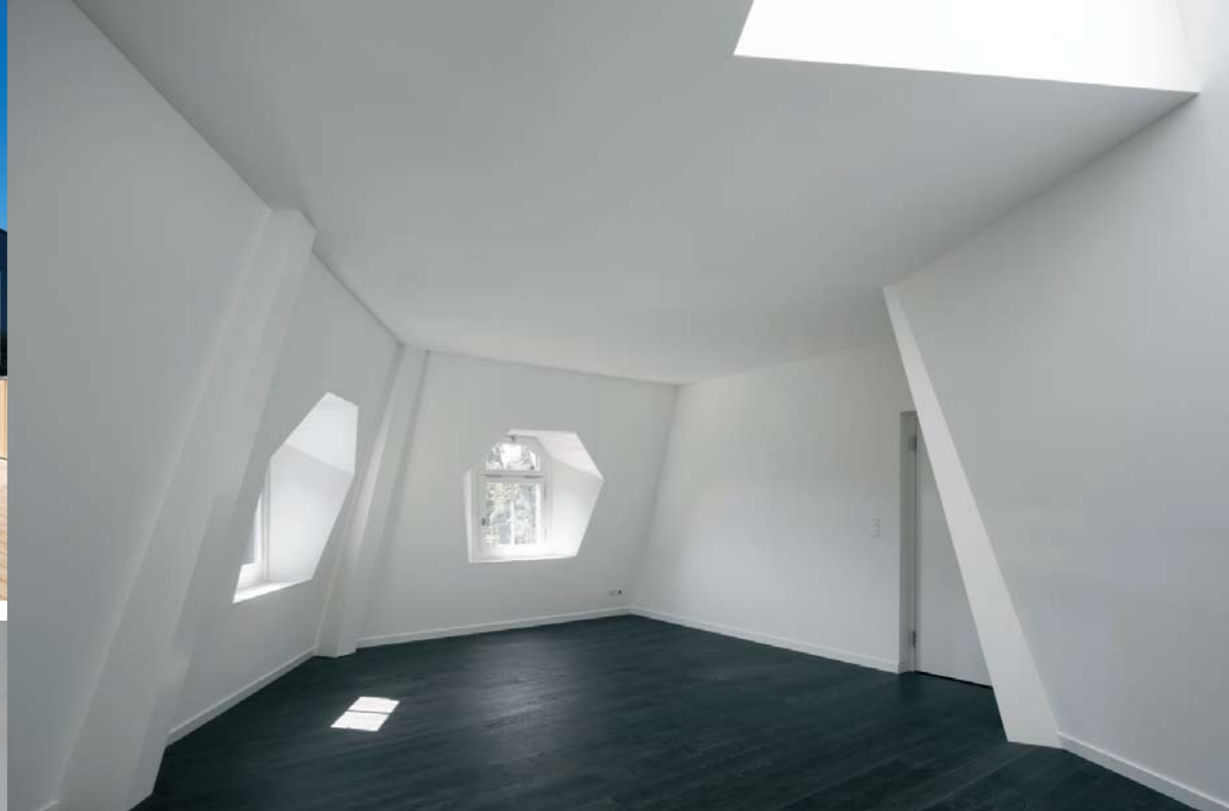
From from above to below, from left to right: Street view, Rooftop terrace, Interior view lobby. Right: Interior view rooftop apartment.